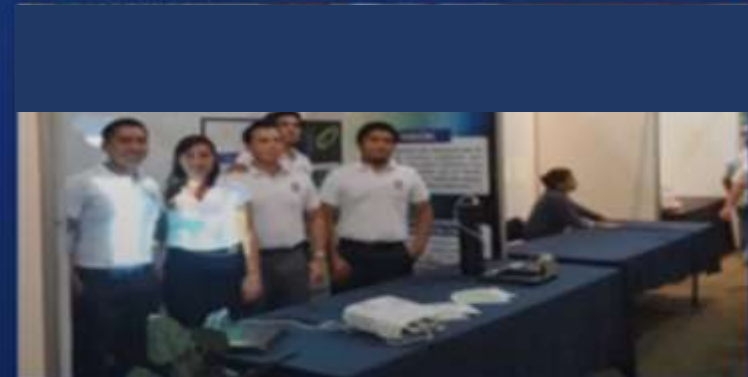
Eventos de Innovación Tecnológica