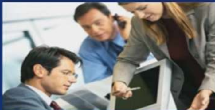
Innovación y Desarrollo Tecnológico