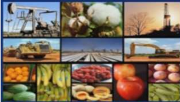
Sectores Social, Productivo, de Bienes y Servicios