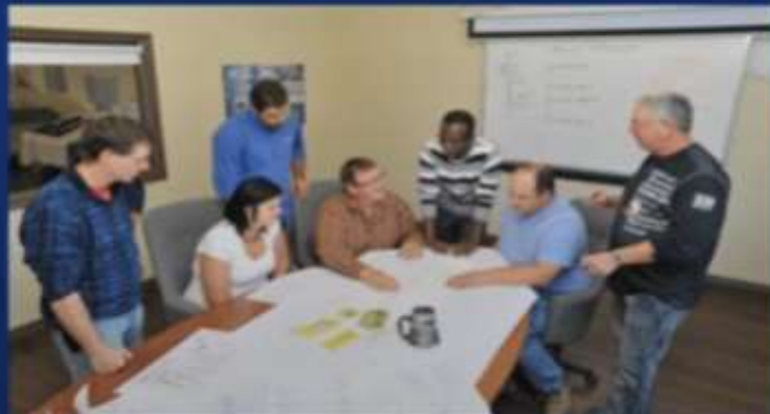
Proyectos propuestos por la Academia autorizados por el Departamento Académico